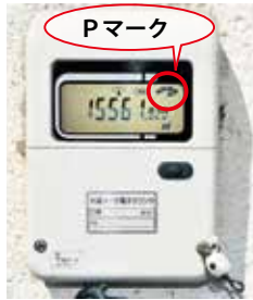
隔測式メーターの表示器