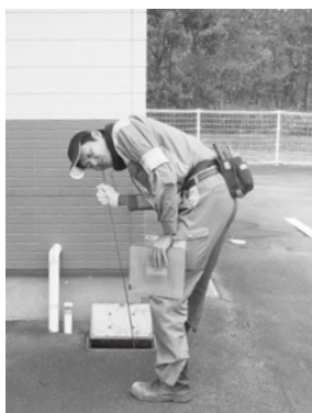
戸別音聴作業の様子