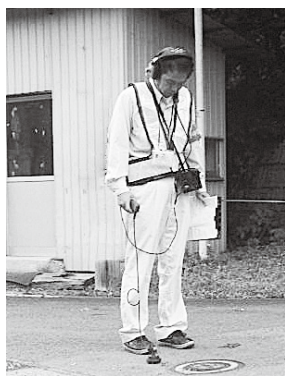
路面音聴作業の様子

なお、調査員は、企業団が発行した身分証明書を携帯しています。不審に思われた際は、証明書の提示を求めてご確認ください。