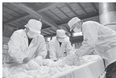
秒単位で吸水管理した米が蒸し上がると、すぐさま布の上に広げ、冷まします。

製造することから、他の酒類とは工程が異なり、複雑で繊細な作業が多くあります。それらのうち、「洗米」「浸漬」は米を蒸す