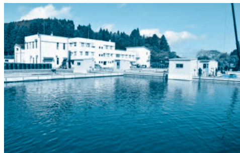
高円万寺浄水場緩速ろ過池

花巻市の高円万寺浄水場では緩速ろ過方式を一部採用しています。微生物のはたらきで浄水をする緩速ろ過方式は、自然界の水循環の方法に近い浄水方法と言えます。