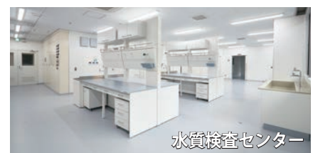
水質検査センター