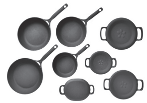
ダクタイルシリーズ

「岩鉄鉄器の人気の理由は軽くてお手入れも簡単な鉄器であり、鉄分も摂取できることです。調理に使う鉄器から食材などに含まれる水分中に鉄分が溶け出します。」