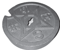
岩手製鉄で製造している仕切弁筐（しきりべんきょう）

企業団は公益社団法人日本水道協会（以下、日水協）の検査委託を受けて、岩手製鉄で製造される水道部材が日水協の規格に適合しているかなどの検査を工場で行っています。