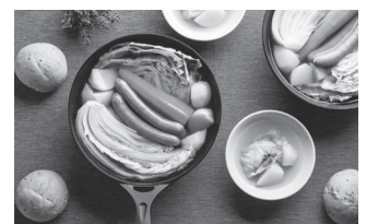
ダクタイルポットを使った炊飯やポトフ